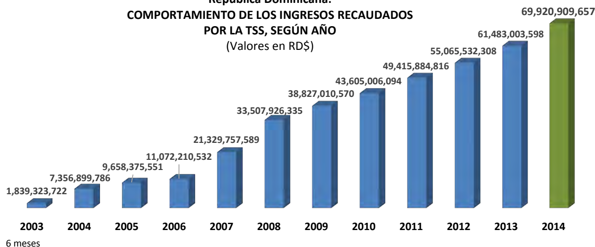
República Dominicana: COMPORTAMIENTO DE LOS INGRESOS RECAUDADOS POR LA TSS, SEGÚN AÑO (Valores en RD$)